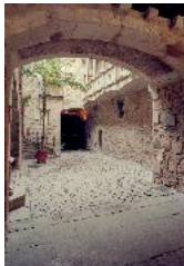
Museum Picasso Innenhof Copyright: Pressefoto wurde zur Verfügung gestellt vom spanischen Fremdenverkehrsamt Tourespana in Berlin anlässlich der ITB 2006. Nutzungsinfos bitte ausschließlich dort erfragen!