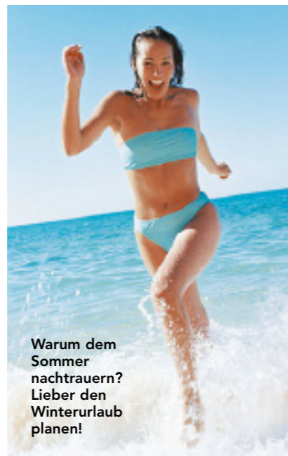
Warum dem Sommer nachtrauern? Lieber den Winterurlaub planen!