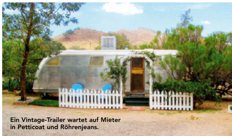
Ein Vintage-Trailer wartet auf Mieter in Petticoat und Röhrenjeans.

INFO www.theshadydell.com ; Miete/Nacht zwischen $ 45,- und 145,-