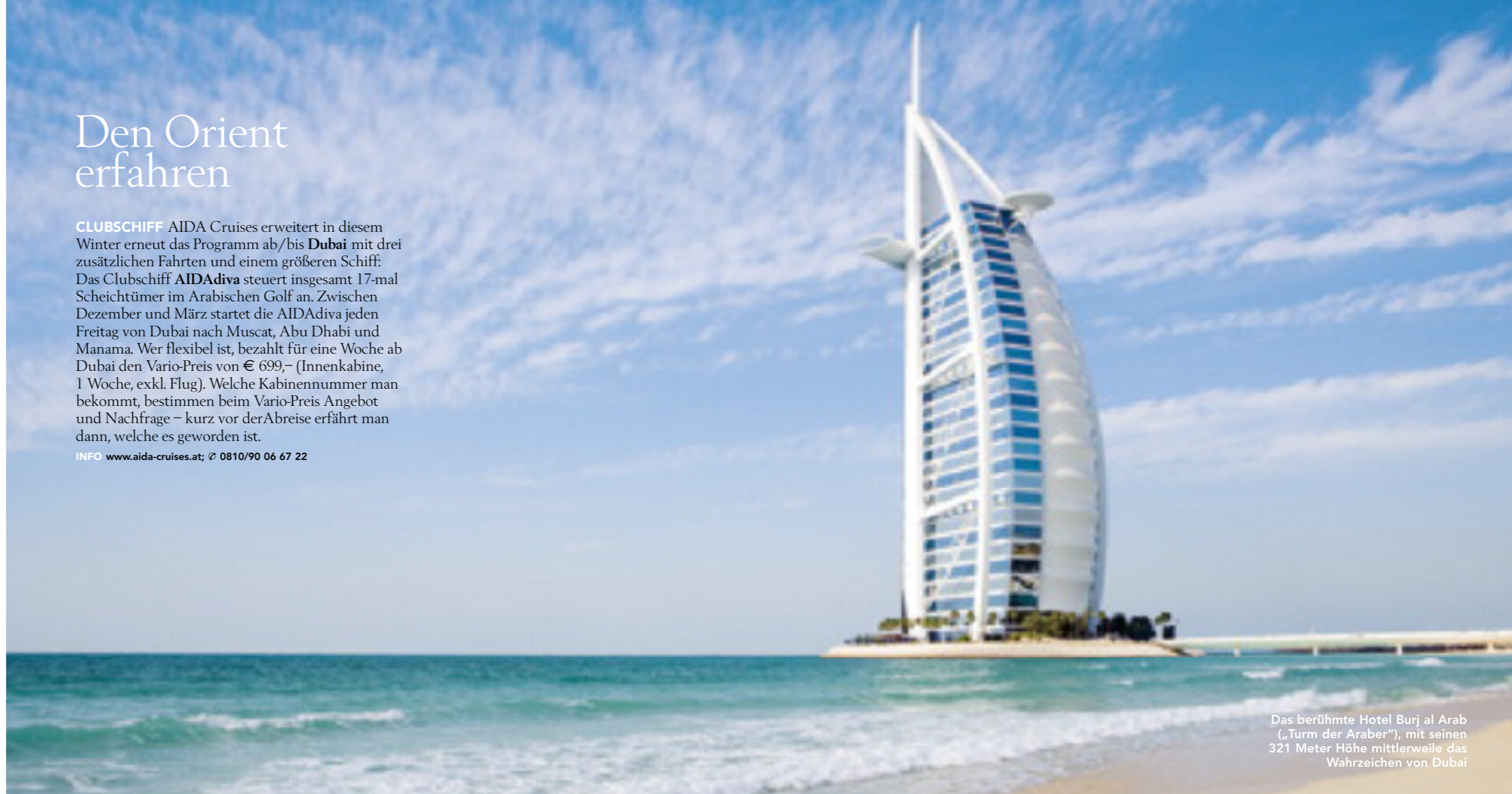
Das berühmte Hotel Burj al Arab („Turm der Araber“), mit seinen 321 Meter Höhe mittlerweile das Wahrzeichen von Dubai

INFO www.aida-cruises.at ; ☎ 0810/90 06 67 22