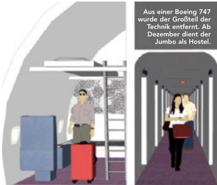
Aus einer Boeing 747 wurde der Großteil der Technik entfernt. Ab Dezember dient der Jumbo als Hostel.

Der Anblick eines auftauchenden Wals oder springender Delfine ist ein höchst eindrucksvolles Erlebnis. Kein Wunder, dass sich Whale Watching als eigener Tourismuszweig etabliert hat. Heute kann man die Meeressäuger in 90 Ländern von der Küste oder vom Boot aus beobachten. In diesem Buch sind alle vorkommenden Wale und Delfine aufgeführt. Eine schematisierte Darstellung von Finne und Fluke (Schwanzflosse) hilft bei der Identifizierung. Ausführlich wird dargestellt, wo und wann man Wale antreffen kann. Top: die grafische Gestaltung. Die Fotoqualität hingegen ist nicht sooo toll.