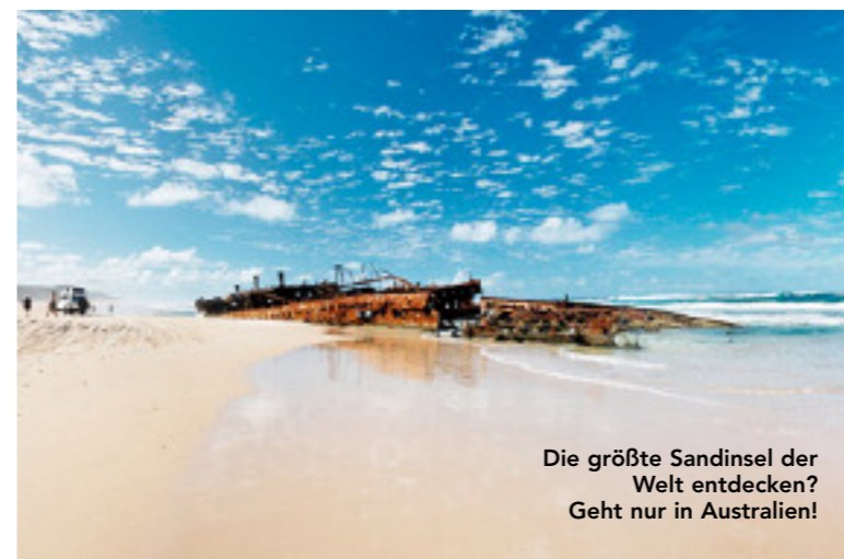
Die größte Sandinsel der Welt entdecken? Geht nur in Australien!

Wie oft haben Sie schon die Erde umrundet? Hätten Sie gar schon den Mond erreicht? Genaue Auskunft über Länge, Dauer und Geschwindigkeit Ihrer Flüge erhalten Sie auf www.flugstatistik.de . Wer möchte, kann auch Flughäfen und Airlines bewerten und sich in der Community austauschen. Oder seine Statistik veröffentlichen und mit anderen Usern in einen Meilen-Wettbewerb treten. Schöner finden wir allerdings das Poster mit einer Darstellung der Flüge: Der individuelle Wandschmuck kostet je nach Größe zwischen € 30,- und € 100,-.