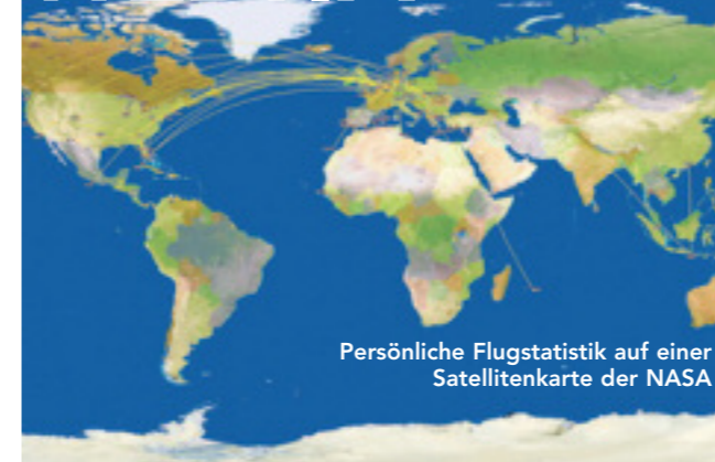
Persönliche Flugstatistik auf einer Satellitenkarte der NASA

Wie oft haben Sie schon die Erde umrundet? Hätten Sie gar schon den Mond erreicht? Genaue Auskunft über Länge, Dauer und Geschwindigkeit Ihrer Flüge erhalten Sie auf www.flugstatistik.de . Wer möchte, kann auch Flughäfen und Airlines bewerten und sich in der Community austauschen. Oder seine Statistik veröffentlichen und mit anderen Usern in einen Meilen-Wettbewerb treten. Schöner finden wir allerdings das Poster mit einer Darstellung der Flüge: Der individuelle Wandschmuck kostet je nach Größe zwischen € 30,- und € 100,-.