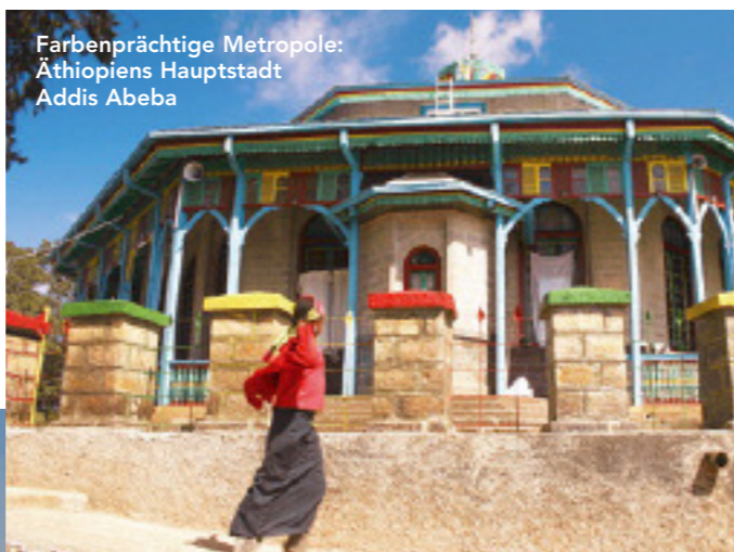
Farbenprächtige Metropole: Äthiopiens Hauptstadt Addis Abeba

INFO www.ikarus-dodo.at , ☎ 01/492 40 95