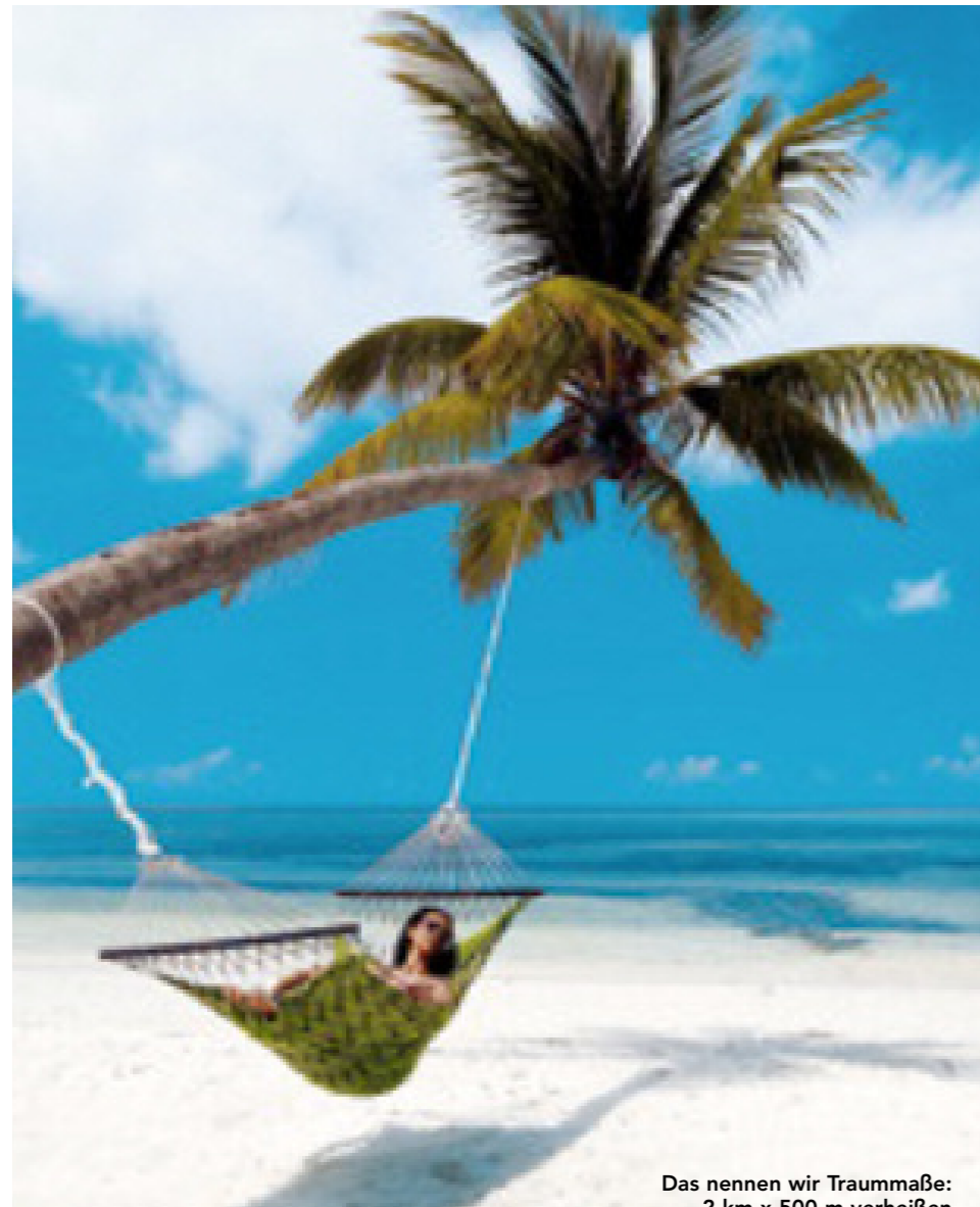
Das nennen wir Traummaße: 2 km x 500 m verheißen pures Inselfeeling!